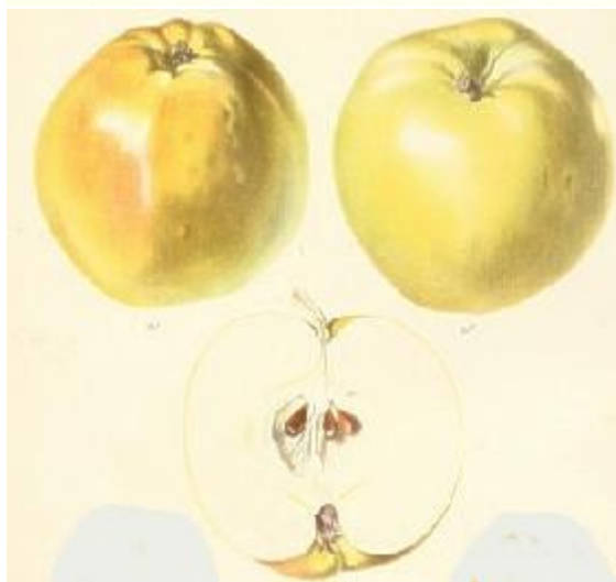
Heidemij, 1868, De Nederlandsche Boomgaard

ORIGINE : Wurtemberg. Décrite par l'allemand Lucas en 1850, par l'allemand Oberdieck 1873, Monats., par le hollandais Heidemij, 1868 De Nederlandische Boomgard pl.15 n°29.